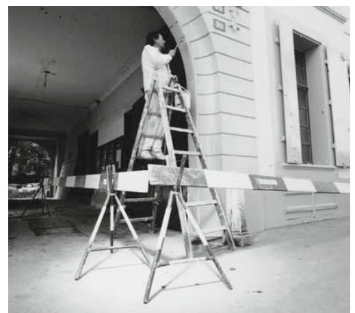
Gesicherter Standort im Verkehrsbereich.