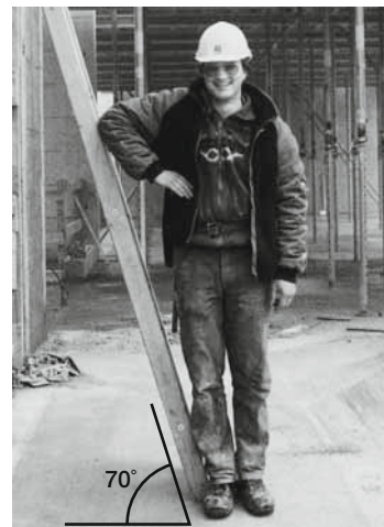
Die richtige Neigung der Leiter lässt sich mit der Ellbogenprobe bestimmen.