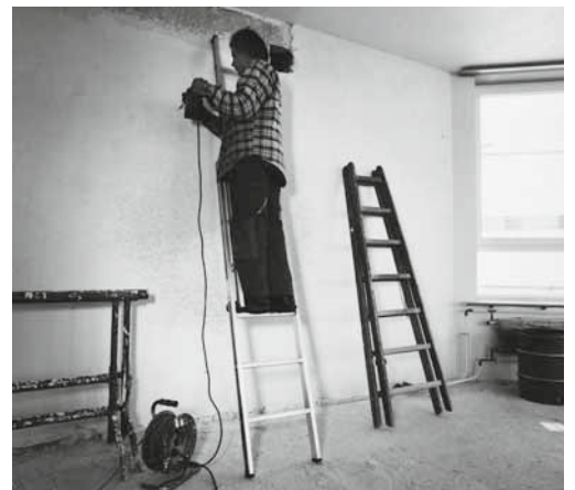
Wenn man eine Bockleiter als Anstell-Leiter benützt, wird durch die einseitige Belastung das Scharnier beschädigt.