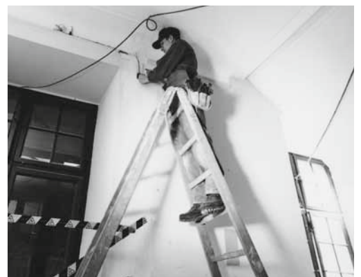
Die obersten 3 Sprossen geben den nötigen Halt.