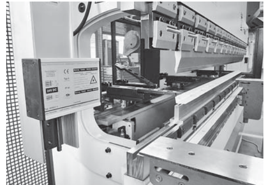
Bild 3: Mit der Oberwanne mitfahrende optische Schutzeinrichtung.