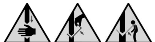
Bild 9: Restrisiken bei der Arbeit an Abkantpressen

Links: Quetschen der Finger, Hände und Arme im schliessenden Werkzeug