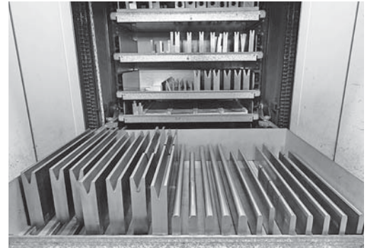
Bild 2: Geordnete Werkzeuglagerung unmittelbar neben der Abkantpresse.