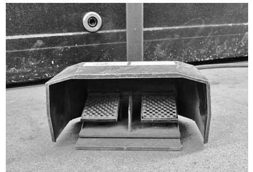
Bild 5: Die Schutzhaube des Fusschalters verhindert eine unbeabsichtigte Hubauslösung.