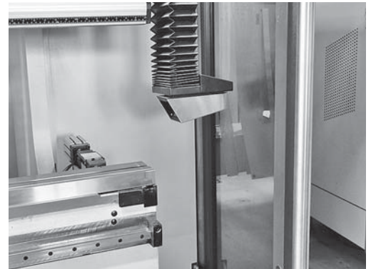
Bild 4: Mitfahrende optische Schutzeinrichtung und seitliche Schutztüre. Der Aufenthalt zwischen der Schutztüre und dem Werkzeug darf nicht möglich sein.