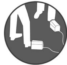
Bild 6: An einer Abkantpresse muss für jeden Bediener ein Sicherheitsfusschalter vorhanden und aktiviert sein.